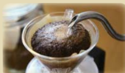
はいからぶれんど珈琲